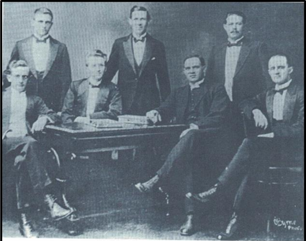
Die stigter van die Broederbond, Hennings Kloppers (sit, tweede van links) en ander lede van die stigterslid van die Afrikaner Broederbond, 1918.

Hierdie foto wys die stigterslede van die Broederbond.